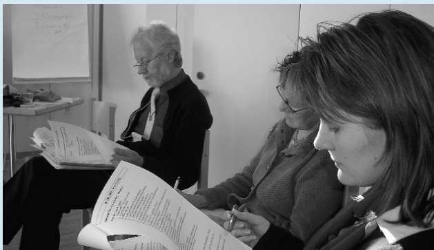
Retraite der Vollzeiter und der Kirchenvorsteherschaft in der «Oase» in Gams: Workshop zur Zielsetzung für das laufende Jahr.