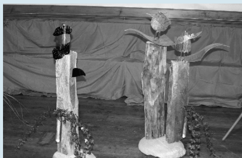
Weihnachtliche Botschafter aus Holzfiguren.