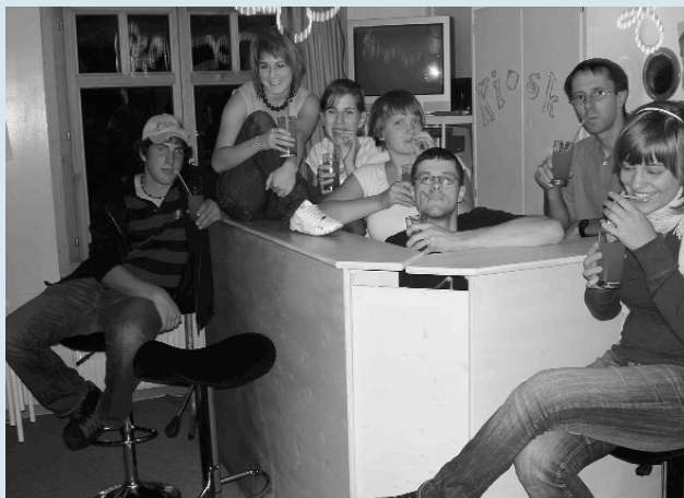
Nach dem Jugendgottesdienst ist das Beizli an der Kirchgasse 2 für alle offen.